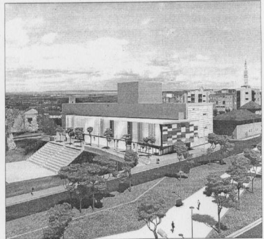
▶ El nuevo equipamiento polivalente estará junto a la biblioteca que se estrenará el próximo mes. Estará acabado en el año 2009.

También contará con un almacén municipal ya para los equipamientos de las entidades.