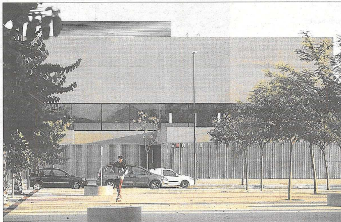
Imagen exterior, ayer tarde, de la Biblioteca Pere Anguera, que mañana será inaugurada.

El Mapa de Lectura Pública de Catalunya recoge las necesidades de la lectura pública y los tipos de servicio bibliotecario que corresponde a cada municipio. También establece unos módulos para dimensionar los equipamientos que permiten definir una estructura teórica básica, y recoge la realidad actual de servicios de biblioteca pública en Catalunya. El análisis de estos datos per-